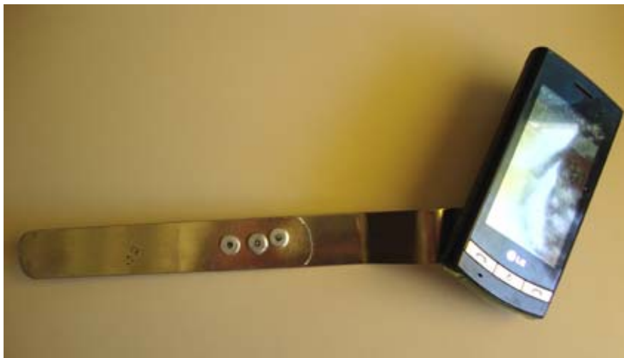
Vista superior del soporte con el teléfono ya unidos.