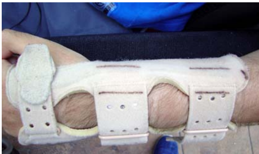
Vista de la férula en la que hemos marcado con rotulador dónde debemos colocar la adaptación. Esto permitirá que, sea quien sea la persona que coloque la adaptación, siempre se ponga en el mismo lugar.