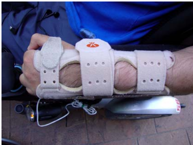
Imagen de la férula de que dispone la persona y a la cual desea que le sea fijado un teléfono móvil.