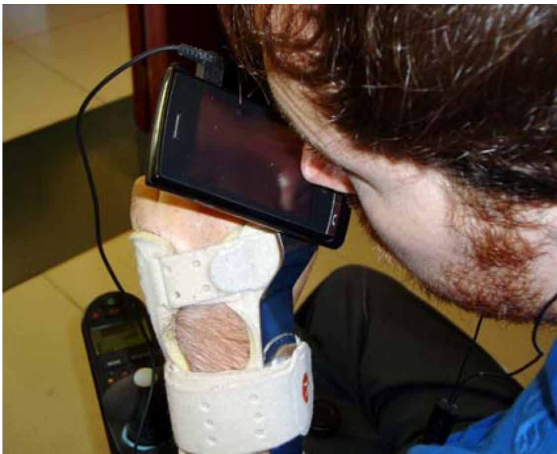
Vista de la adaptación acabada y que permite a su dueño acceder las distintas opciones del teléfono por medio de la nariz y boca.