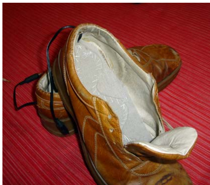
Los zapatos con su plantilla.