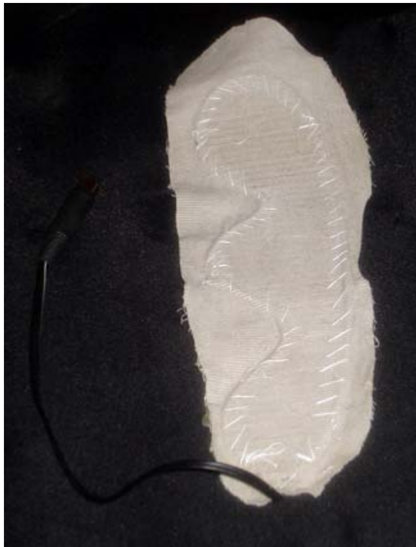
Vista de la plantilla.