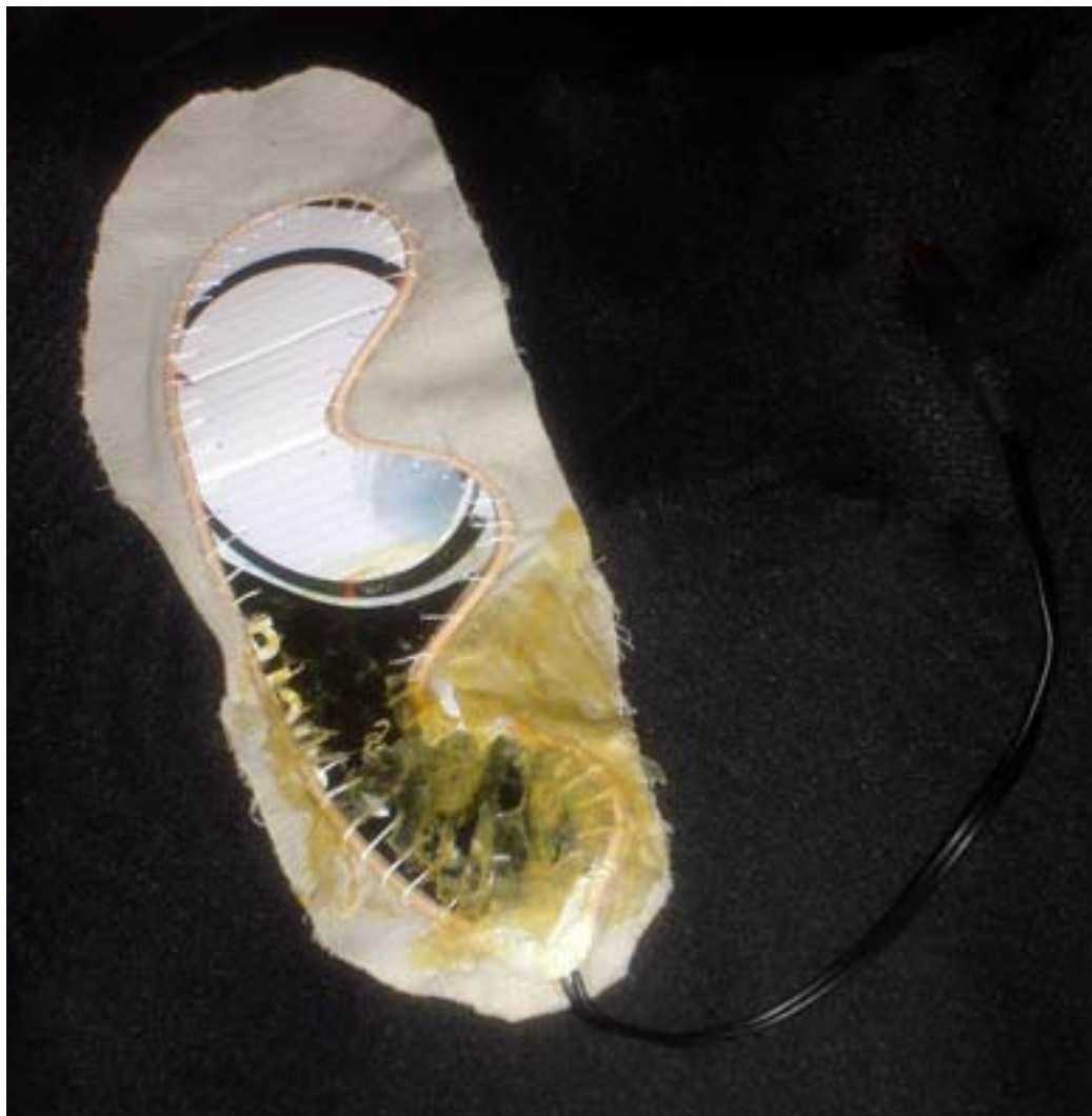
Fijación del cable calefactor.