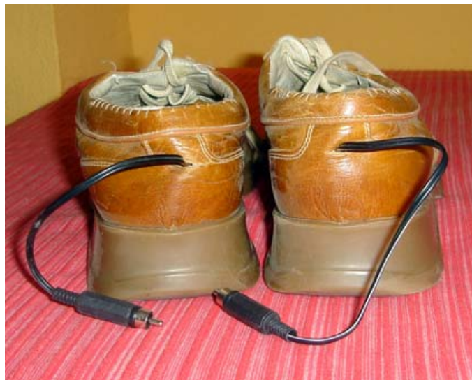
Salida de los cables por la parte posterior de los zapatos.