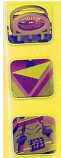
Vista de detalle de elementos de la plataforma.