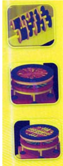
Vista de detalle de elementos de la plataforma.