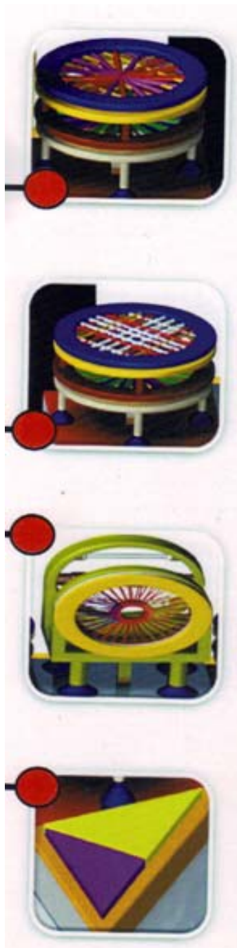
Vista de detalle de elementos de la plataforma.