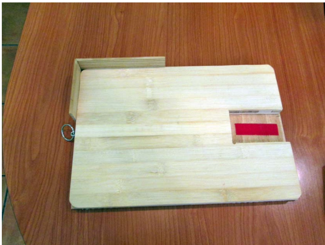
Imagen de la tabla sin la parte de puntas.