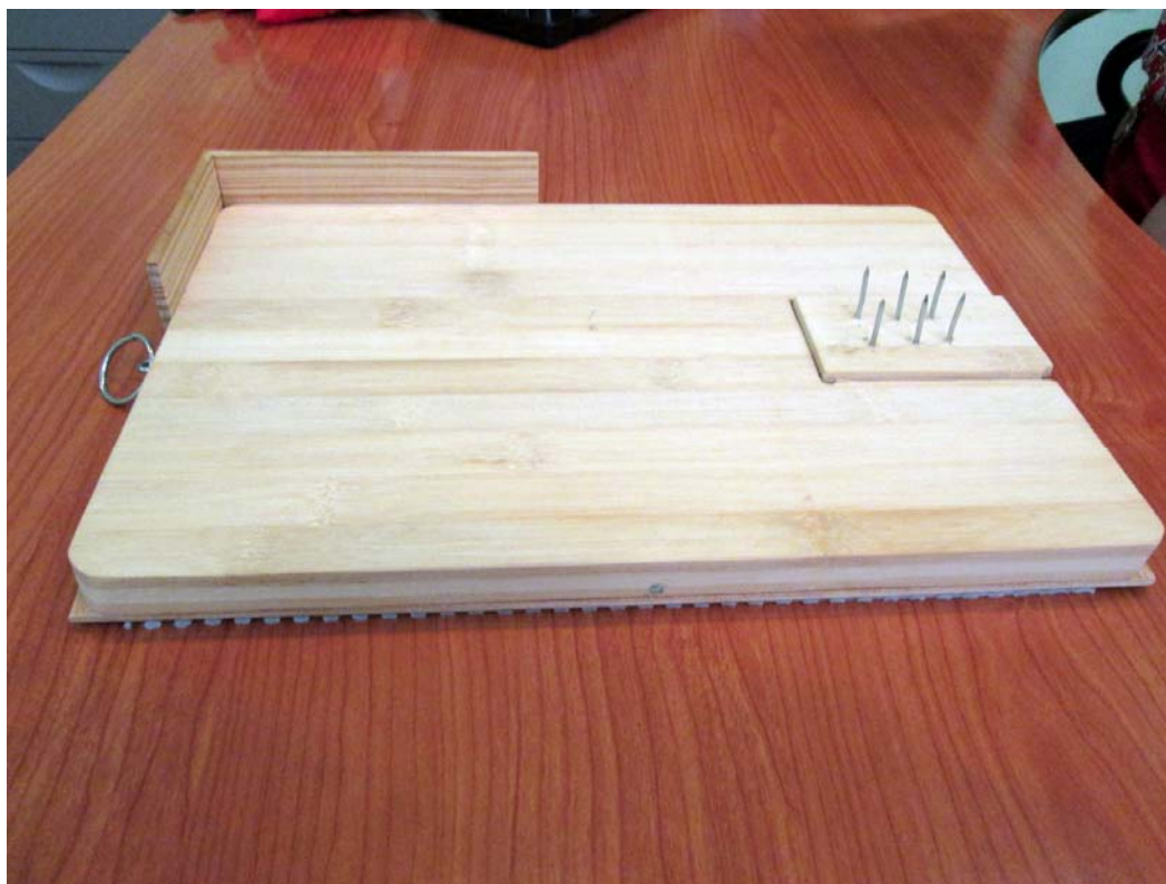
Imagen de la tabla con la parte de puntas montada.