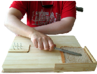
Tabla de preparar alimentos.