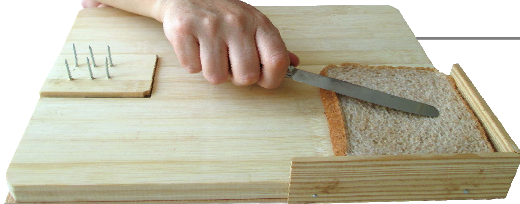
Tabla de preparar alimentos.