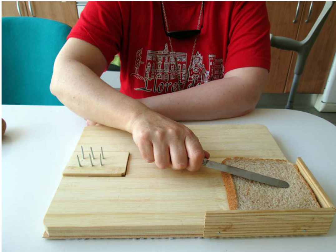
Uso de la tabla con tareas de untado.