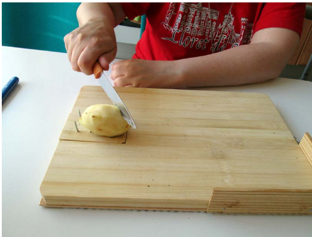
Uso de la tabla con tareas de corte.