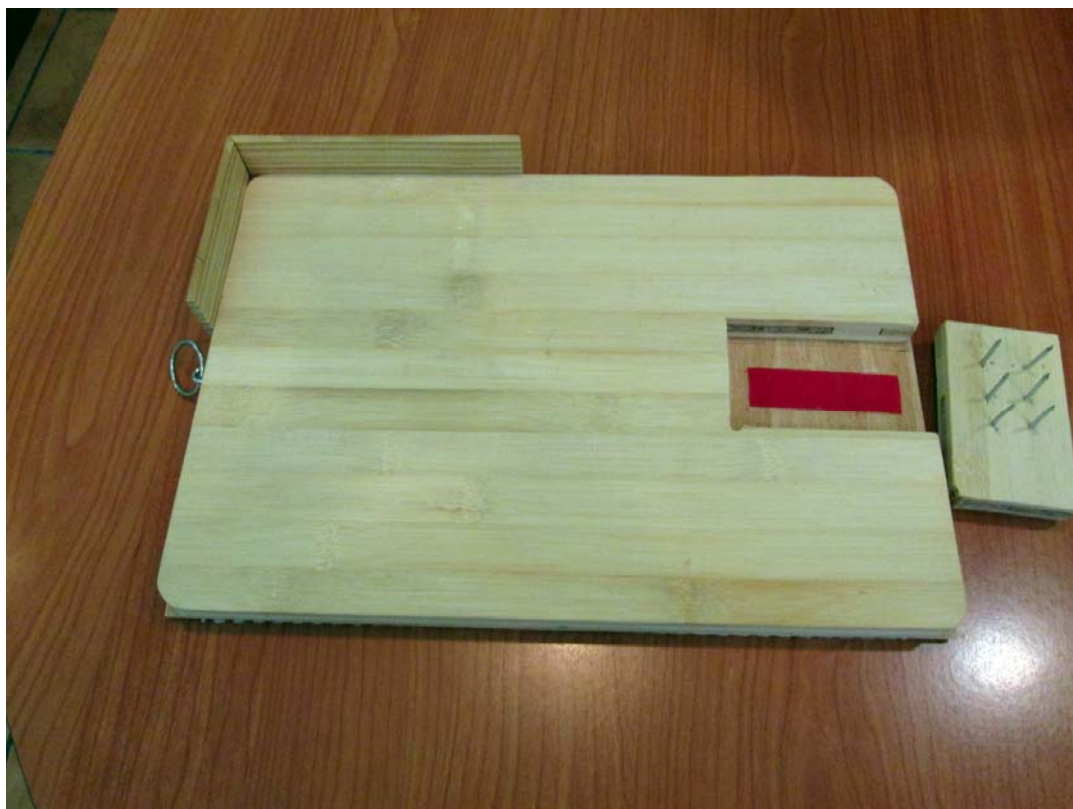
Imagen de la tabla con la parte de puntas desmontada.