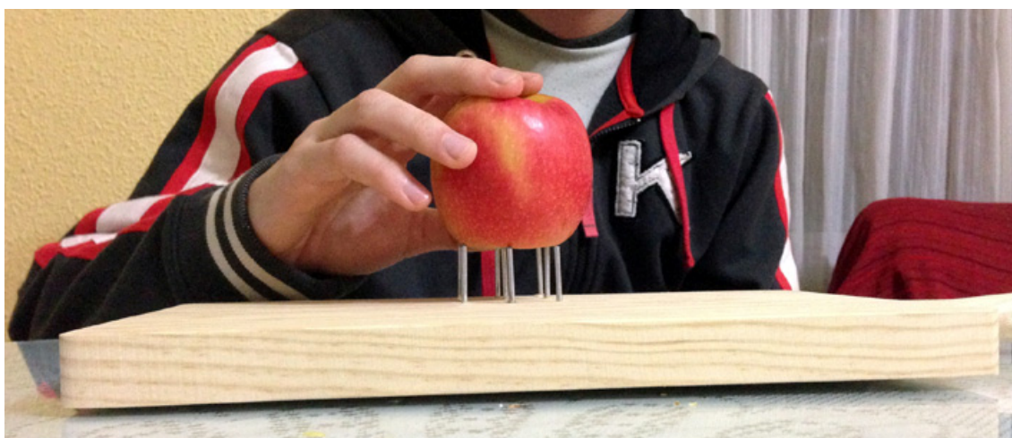
Clavando una manzana en la tabla de pelar.