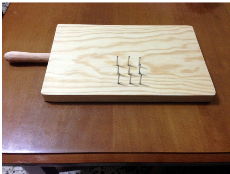
Imagen completa de la tabla de pelar.