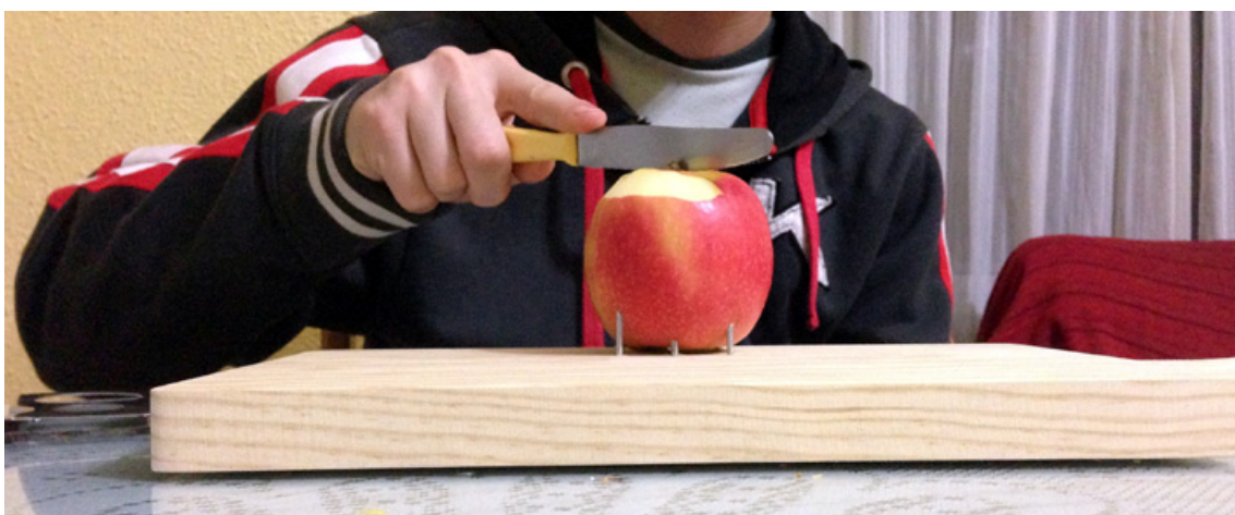
Cortando la manzana clavada con un cuchillo.