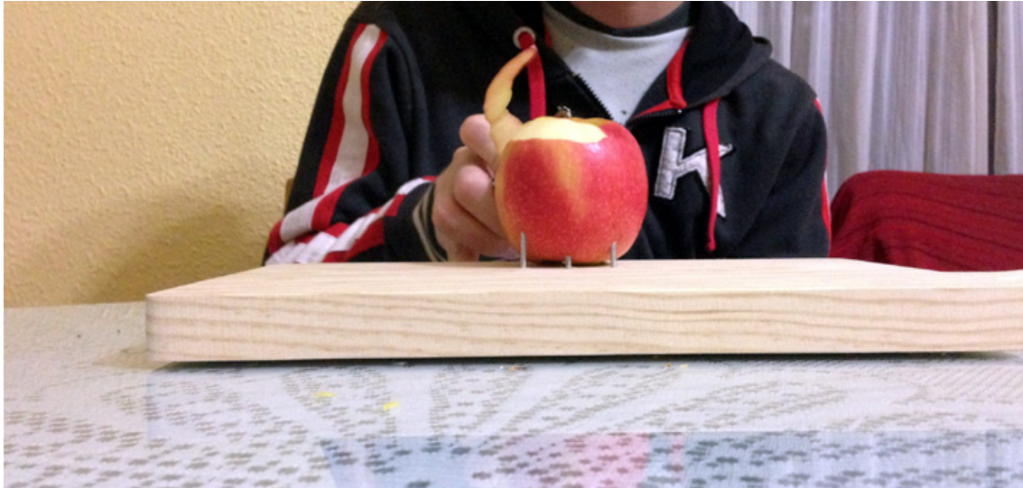
Pelando la manzana ya clavada con un pelador.