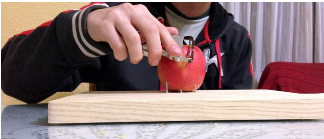
Pelando la manzana ya clavada con un pelador.