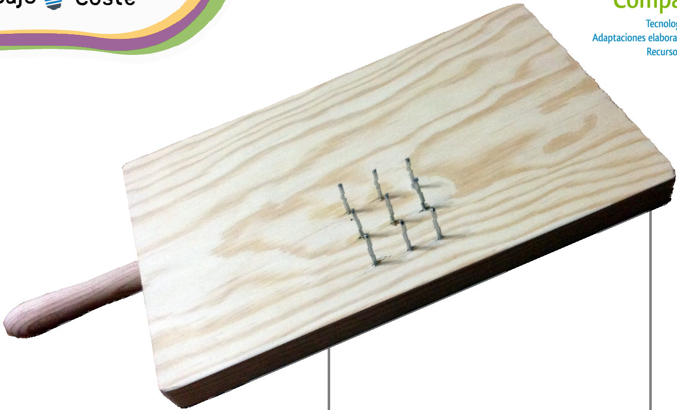
Tabla de Pelar y cortar alimentos.