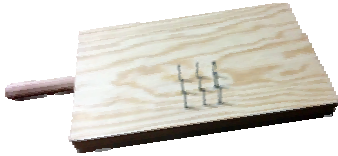
Tabla de Pelar y cortar alimentos..