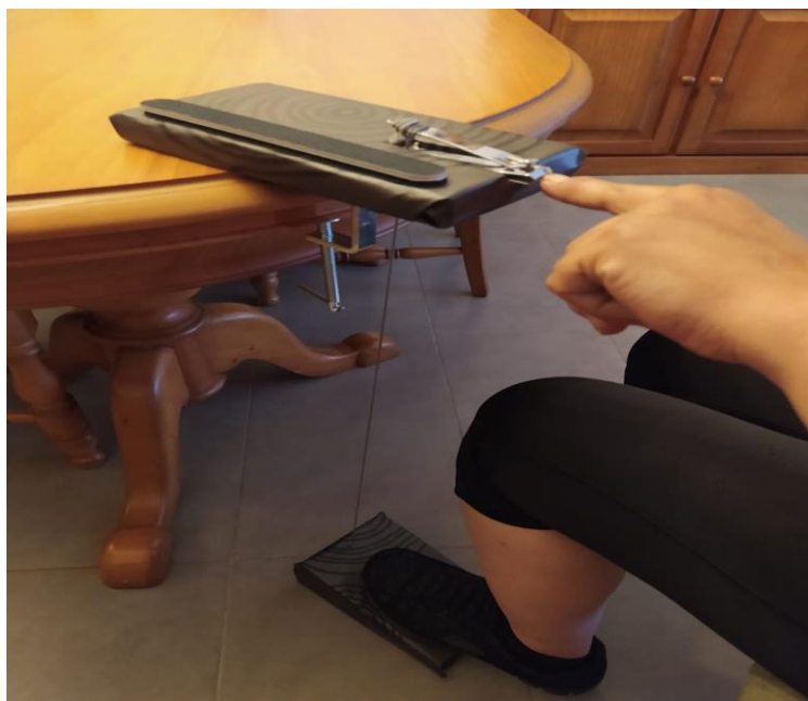
Poniendo en funcionamiento el cortaúñas a pedal.