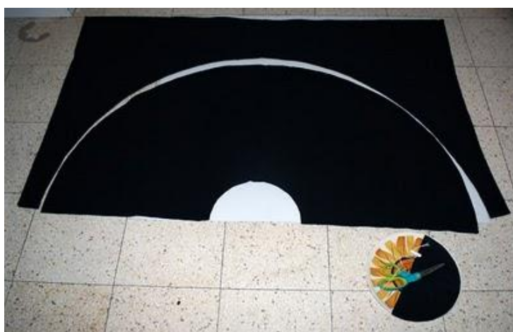
PATRON DE CORTE.