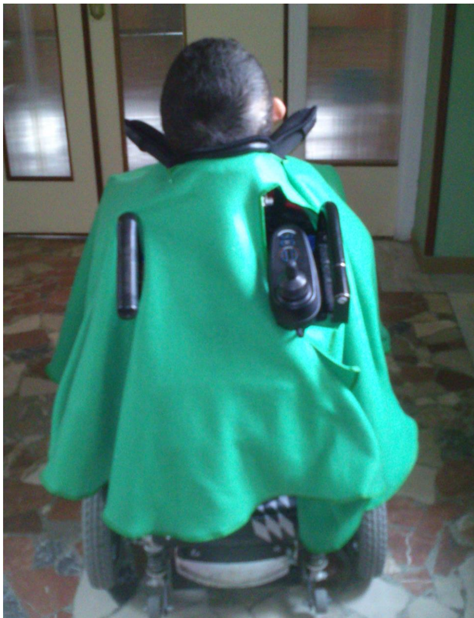
VISTA POSTERIOR DE LA SILLA CON LA CAPA POLAR.