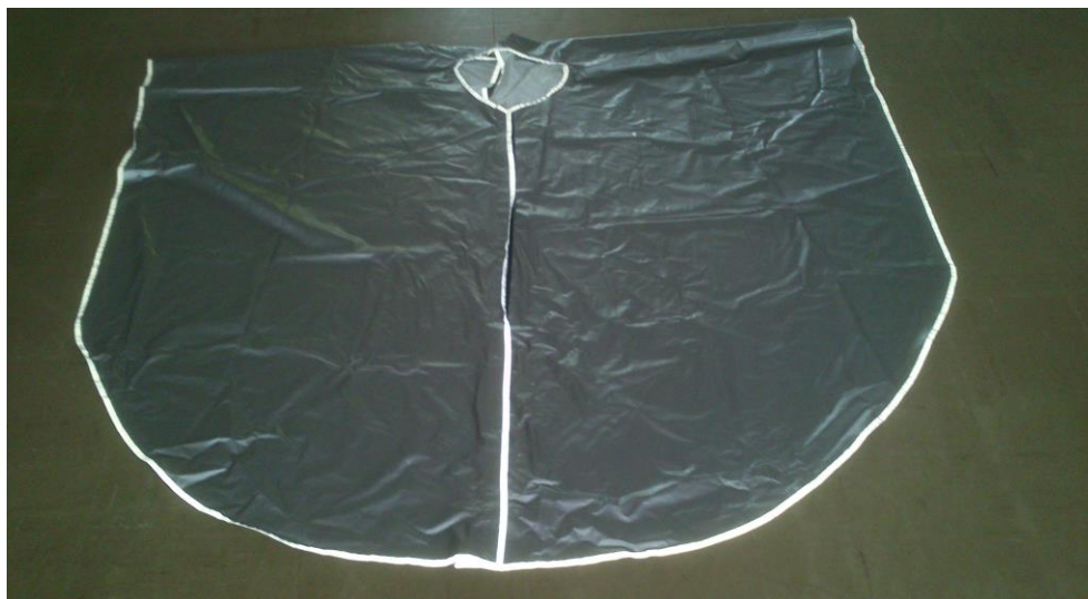
VISTA ANTERIOR DE LA CAPA IMPERMEABLE.