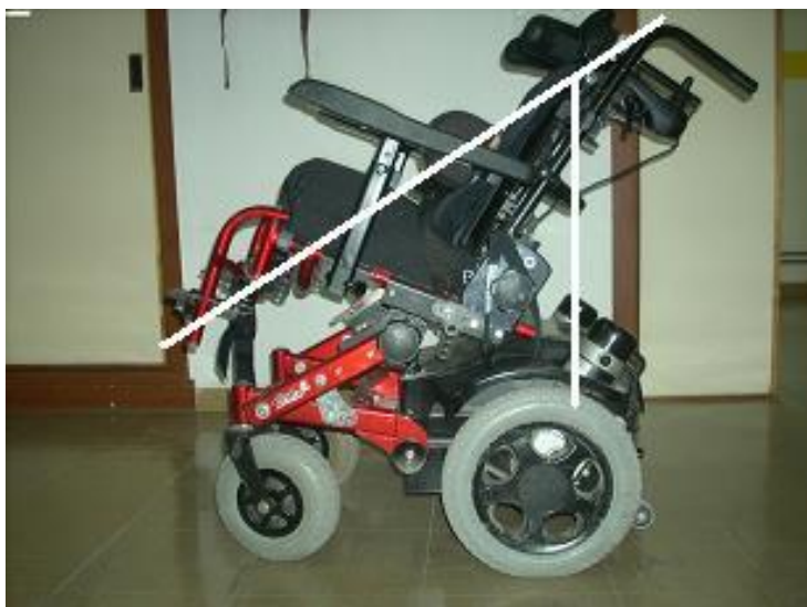
MEDIDAS A TOMAR EN LA SILLA DE RUEDAS.