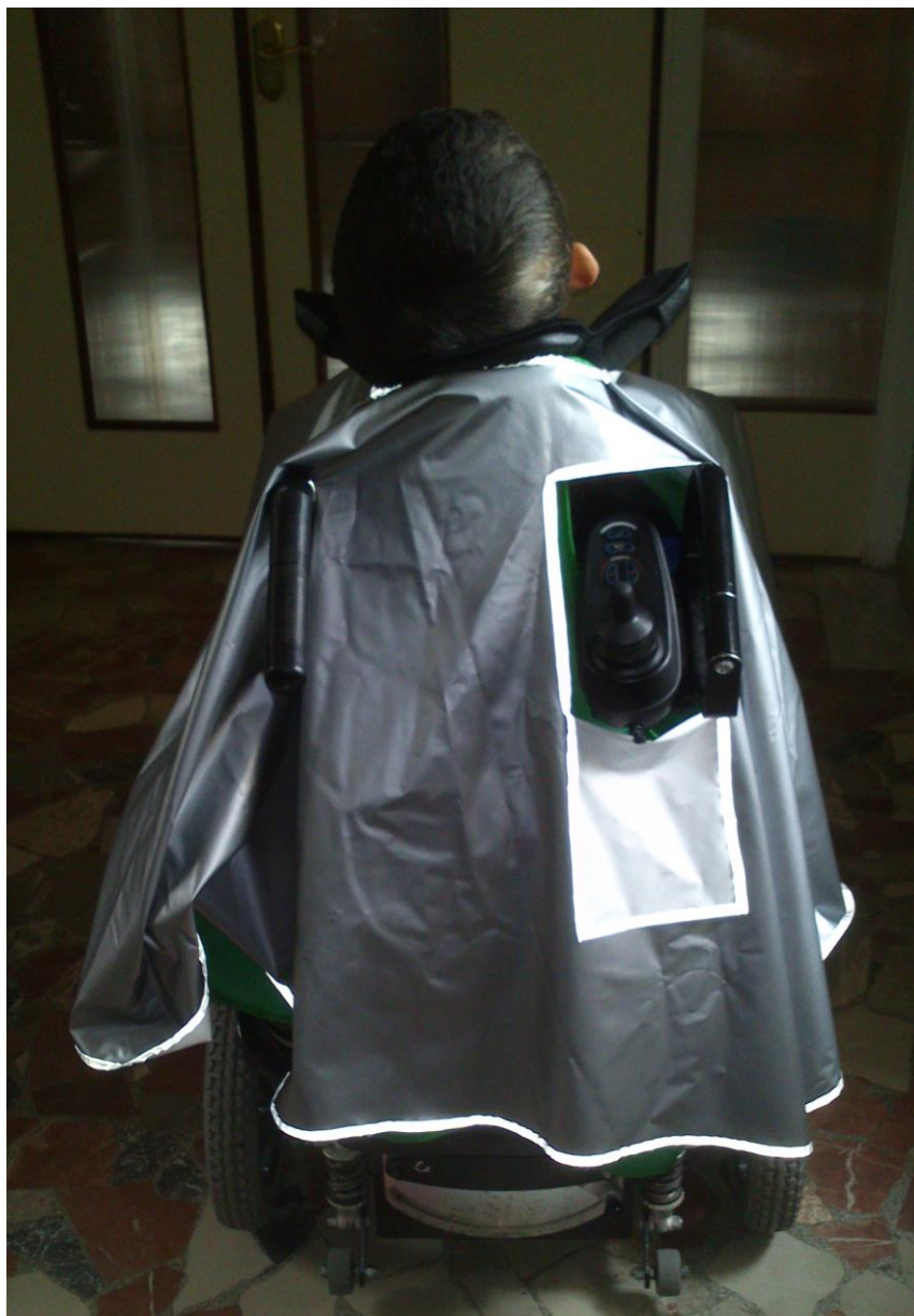
VISTA POSTERIOR DE LA SILLA CON LA CAPA IMPERMEABLE