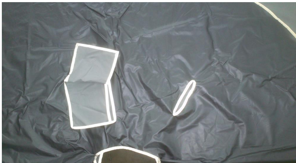
ABERTURAS PARA MANDO Y ASA DE LA SILLA EN LA PARTE POSTERIOR.