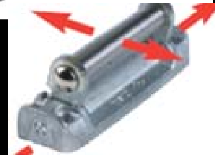
Cerradura eléctrica superficie