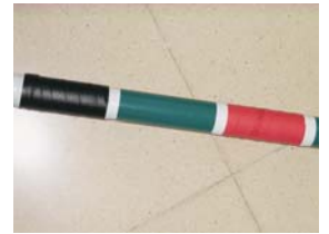
Coloca las empuñaduras a la altura que necesites (cada persona necesita su altura).

Coge un color que contraste bien con el color de puntal.